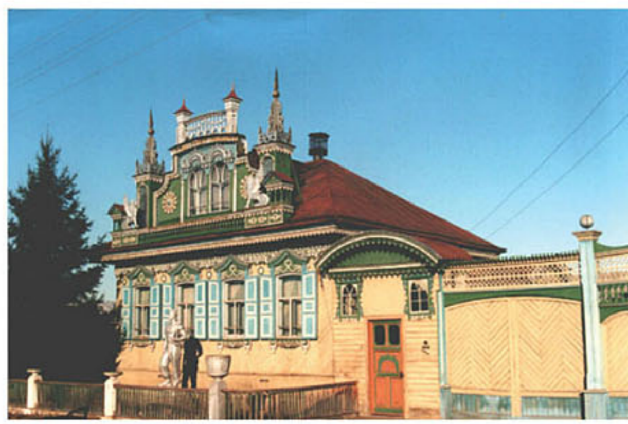
Курагино (Красноярский край)