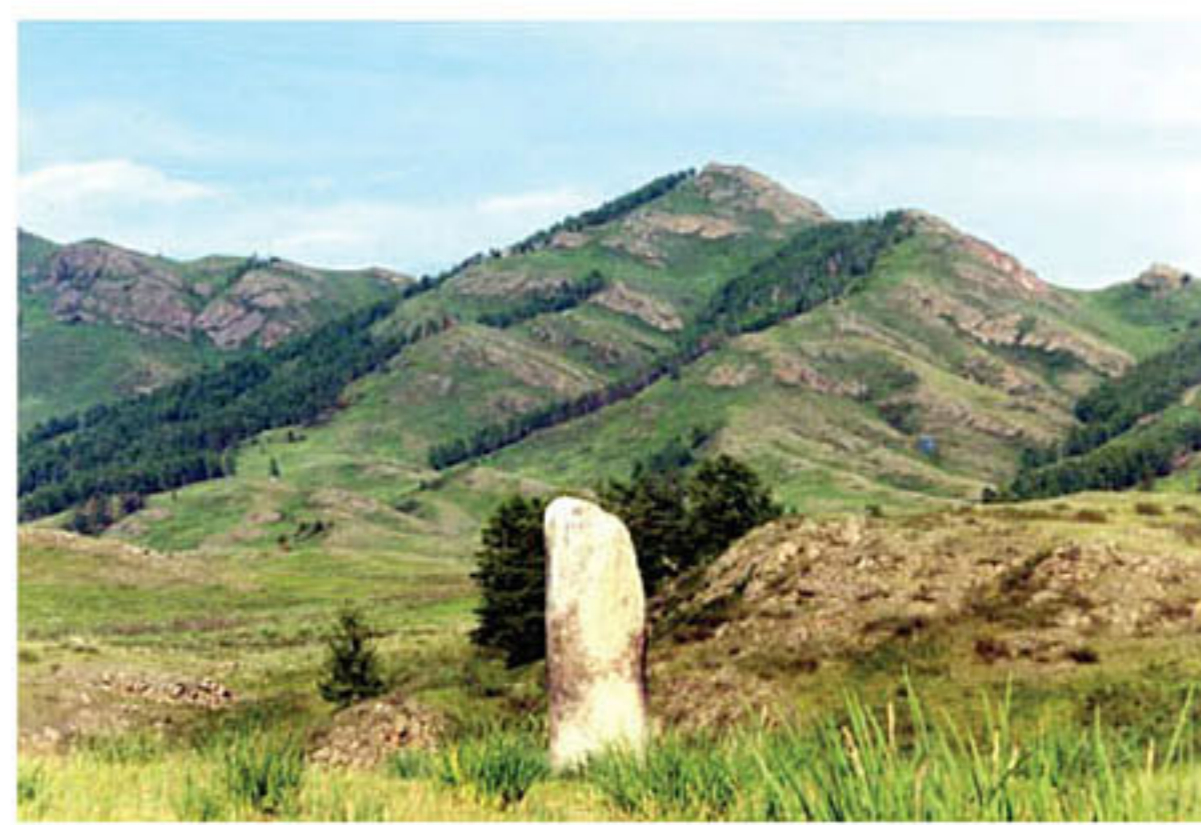
Мензирь (Республика Хакасия)