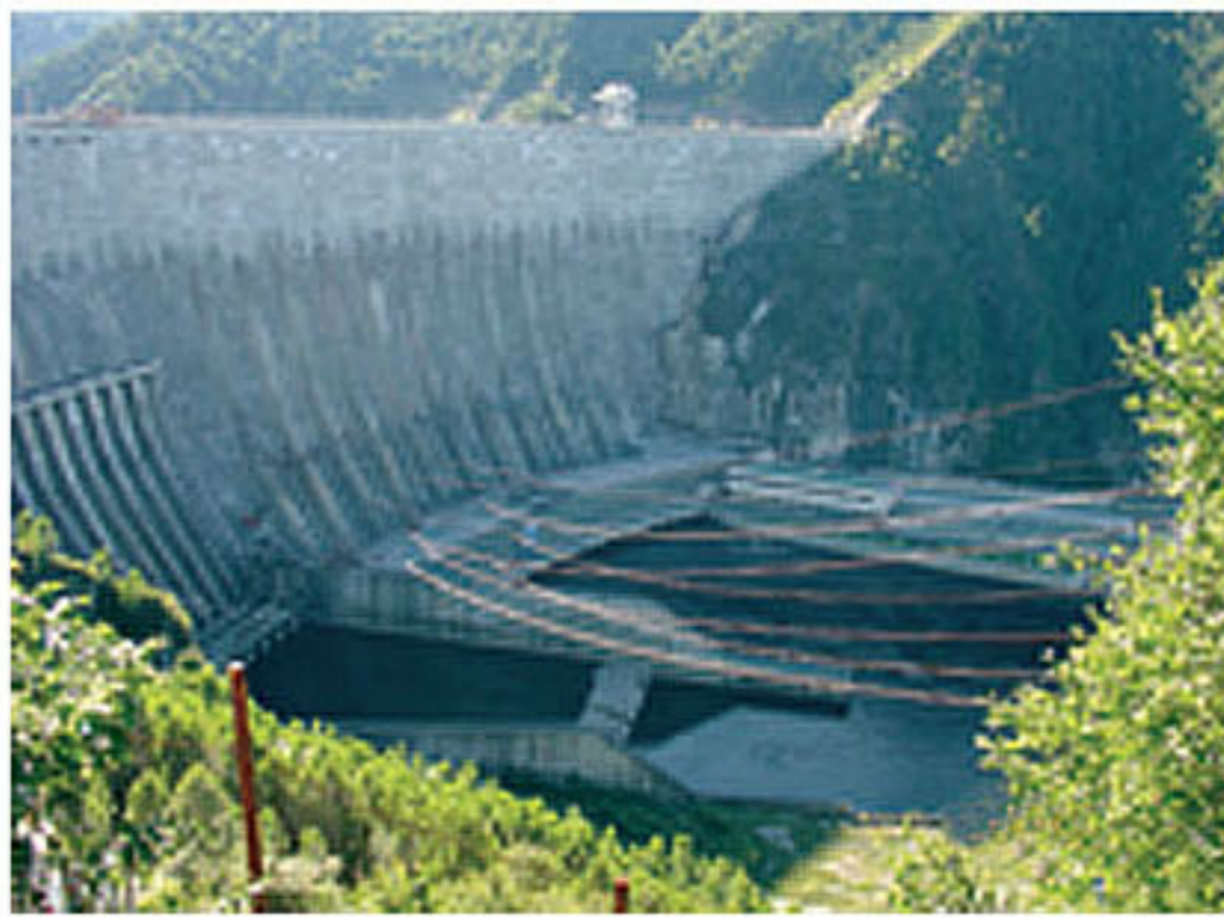
Саяно-Шушенская ГЭС (Красноярский край)