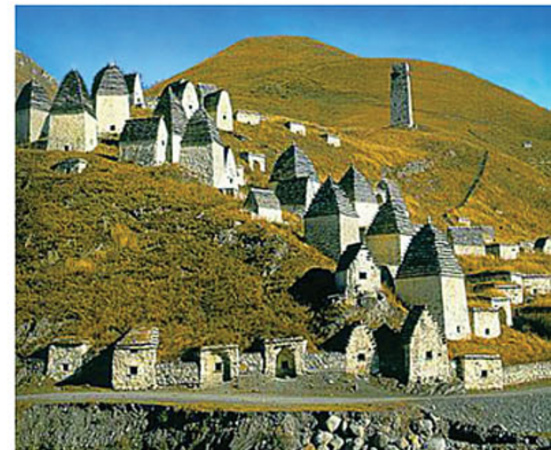
Город Мертвых (село Даргавс)