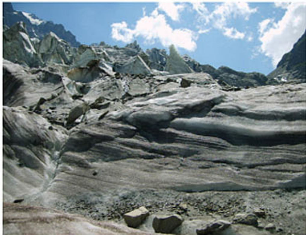
Северо-Осетинский заповедник. Ледник