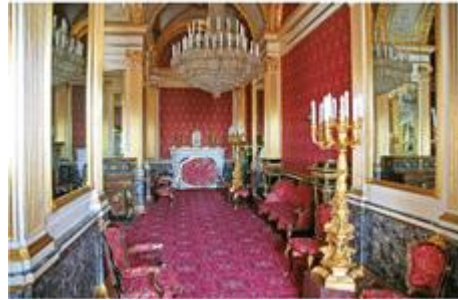
Убранство Большого Кремлевского дворца