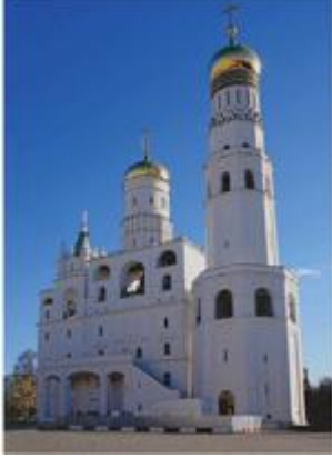
Колокольня Ивана Великого