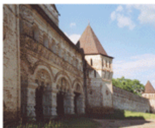
Сретенская надвратная церковь