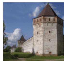
Стены и башня монастыря