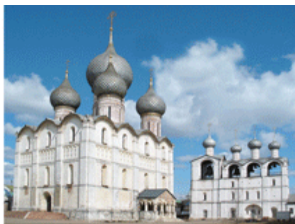
Успенский собор и звонница