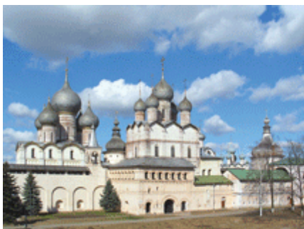
Комплекс сооружений кремля

в. Сейчас на территории кремля расположен государственный музей-заповедник «Ростовский кремль». В его коллекции: собрание икон XV-XIX вв., изделия из серебра, лицевого шитья, фарфора, керамики и бисера. Богатейшее собрание русской живописи XVIII – начало XX вв. и современных художников. С 2000 г. образован единственный в России музей финифти, с коллекцией ростовской финифти XVIII-XX вв., промысла, прославившего Ростов. В 1995 г. Ростовский кремль включён в Государственный свод особо ценных объектов культурного наследия Российской Федерации