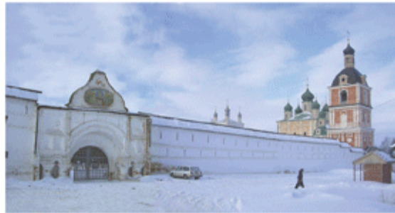
Успенский Горицкий монастырь