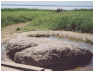
"Синий камень" - природный и исторический памятник