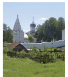
Свято-Троицкий Даниловский монастырь