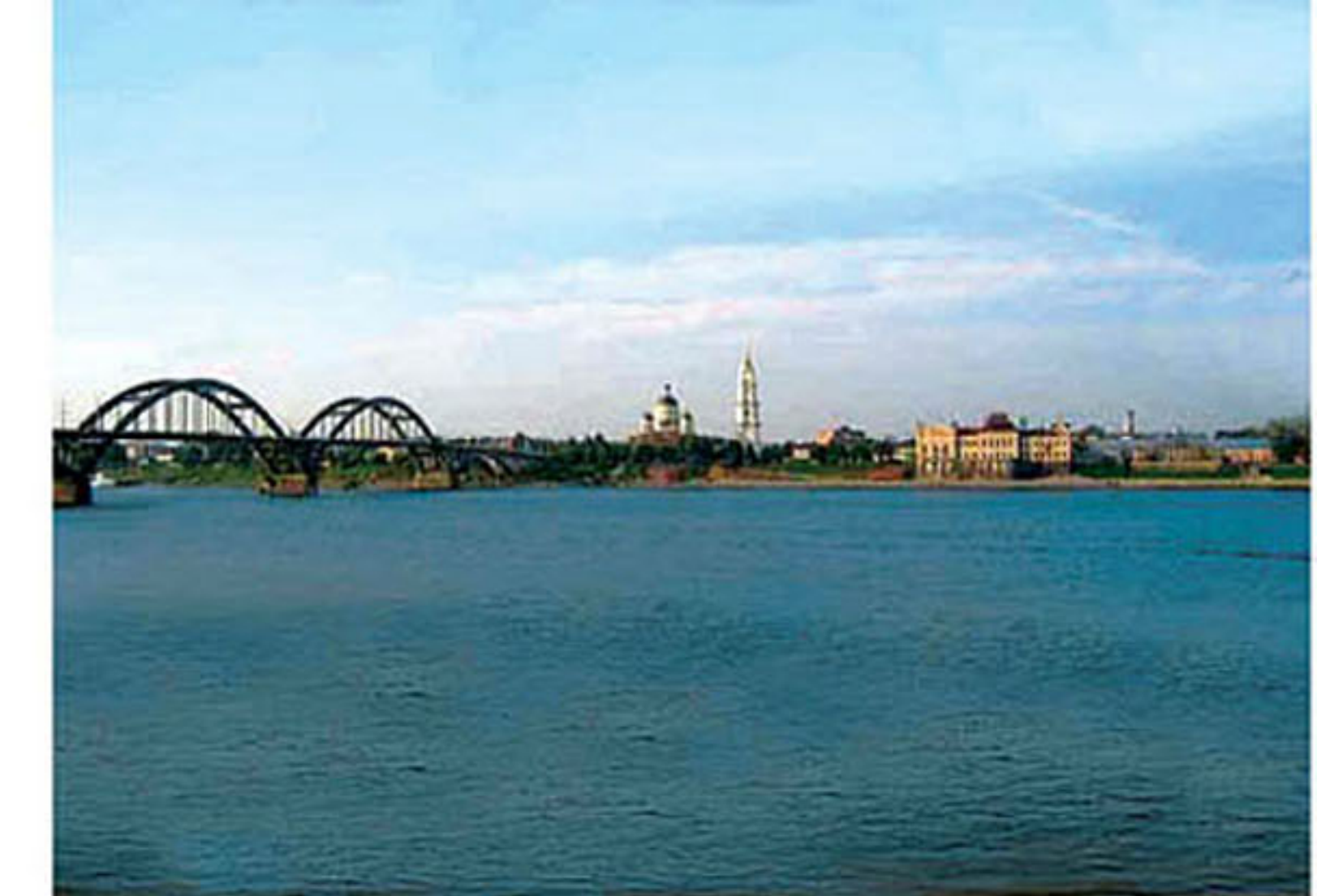
Рыбинское водохранилище вблизи города Рыбинска