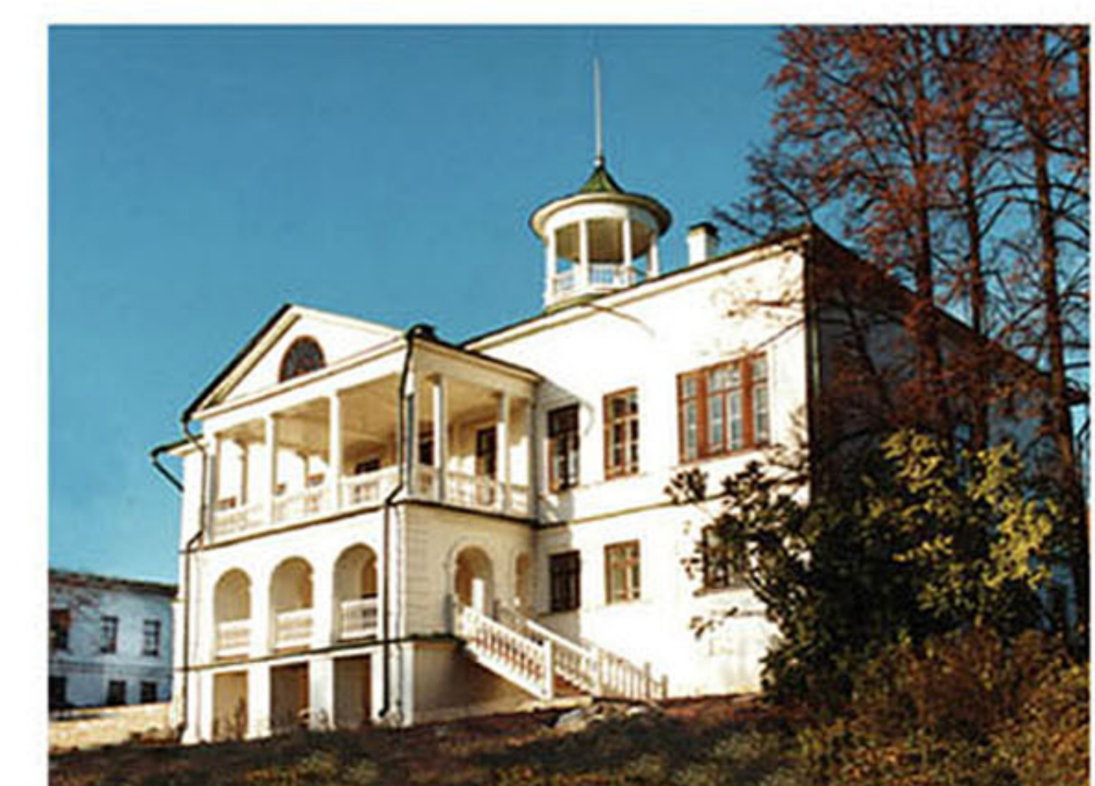
Музей-заповедник Н.А. Некрасова «Карабиха»