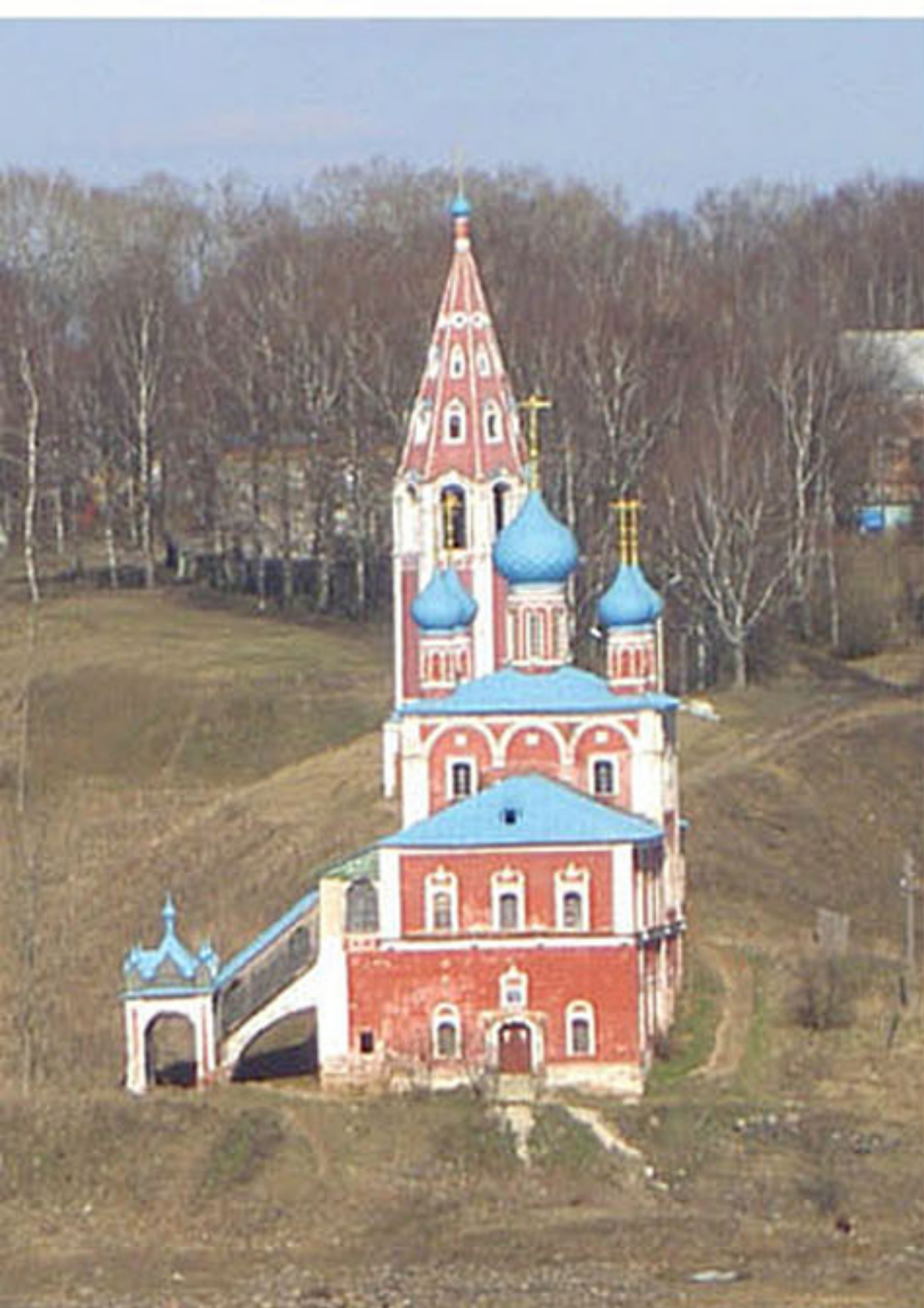
Казанская церковь (город Тутаев)