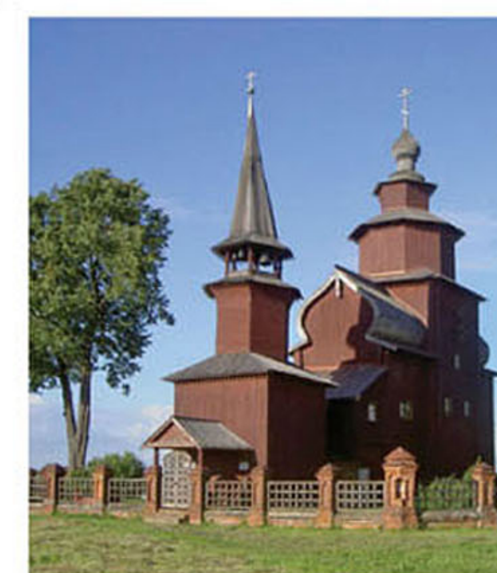
Церковь Иоанна Богослова (поселок Ишня)