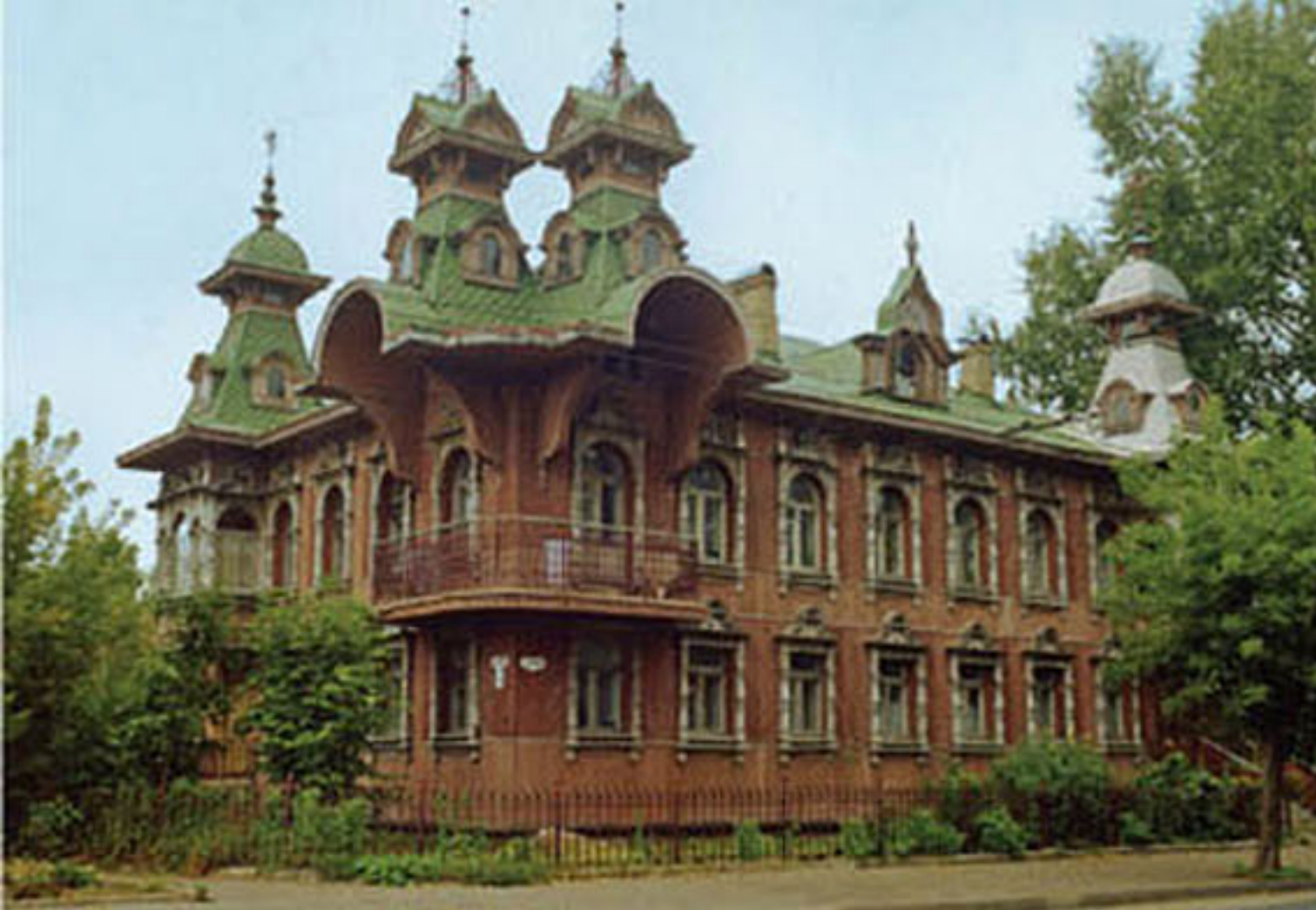
Особняк Копылова (город Рыбинск)