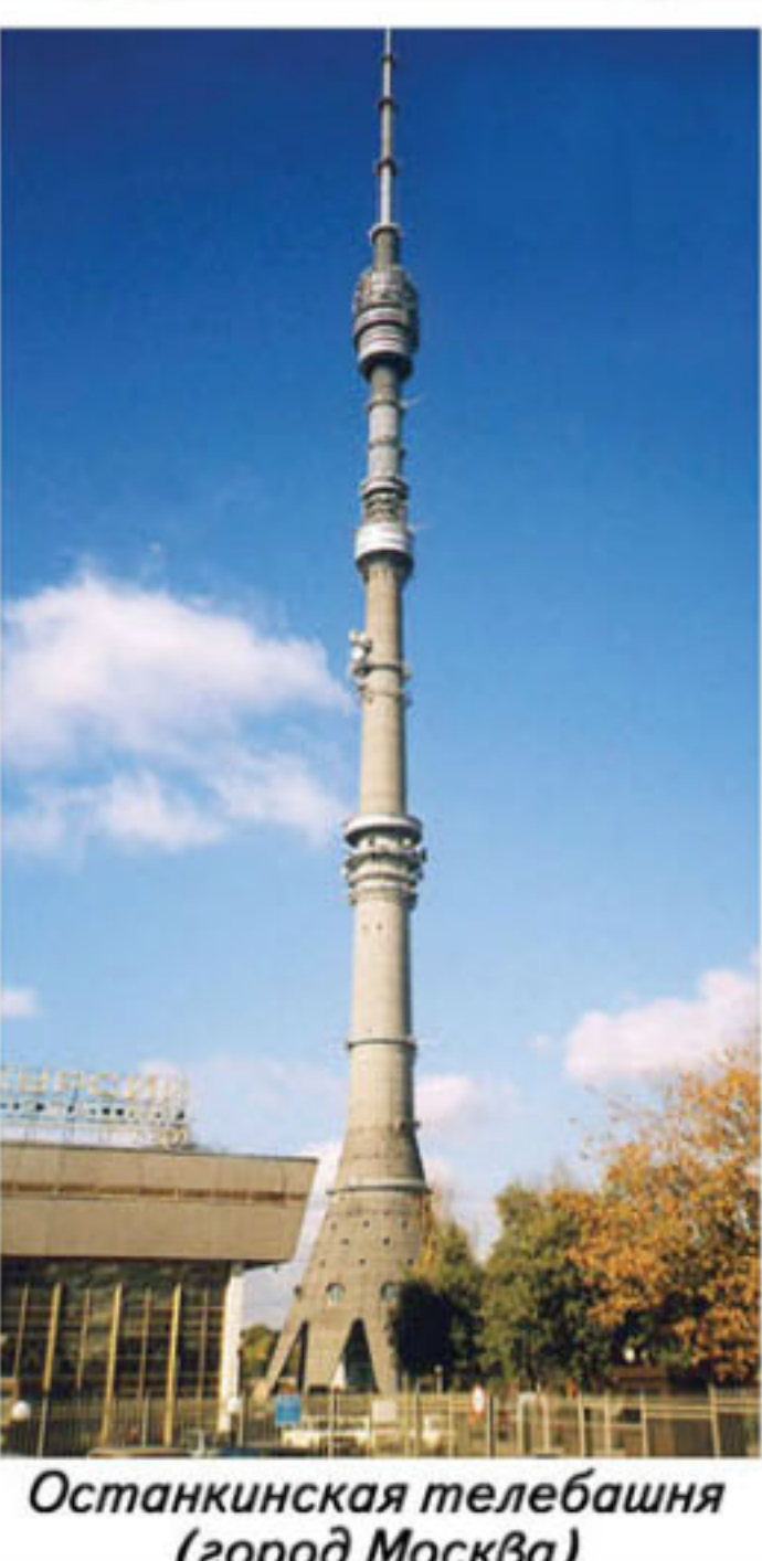
Останкинская телебашня (город Москва)