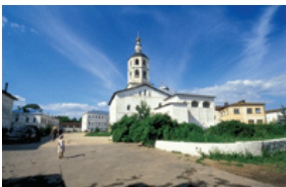
Боровский женский монастырь (Калужская область)

В монастырях зачастую применялись и получали оригинальное развитие рациональные формы хозяйствования. Особенно ярко это проявилось в Валаамском и Соловецком монастырях. Монашеские обители Русского Севера и Сибири, помимо миссионерского назначения, помогали экономическому освоению удалённых земель с суровым климатом. Архиерейские дома (специфическая разновидность монастырей) в Москве, Ростове Великом, Рязани внесли значительный вклад в древнерусское градостроительство. Принципиальные новшества в православное культовое зодчество внесли Валдайско-Иверский и Ново-Иерусалимский монастыри, созданные в середине XVII в. при активном участии патриарха-реформатора Никона. С давних времён большинство русских монастырей было отгорожено высокими деревянными стенами от мирской суетной жизни. С 1540-х гг. самые богатые монастыри