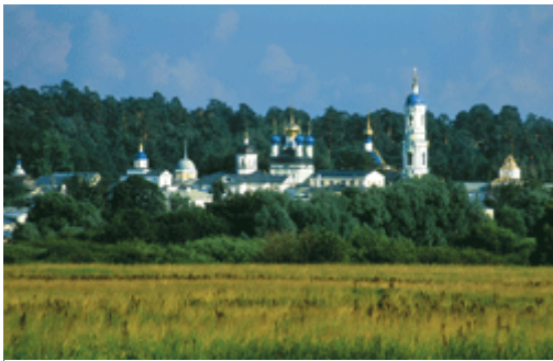
Оптина пустынь (Калужская область)

К началу XX в. Российская империя имела множество монастырей, включая единоверческие, старообрядческие-нонконформистские, католические и ламаистские. Однако подавляющее большинство составляли обители Русской Православной Церкви; их было чуть более тысячи, а к октябрю 1917 г. добавилось ещё около 250. Большая часть монашеских обителей была ликвидирована при советской власти. Их превращали в концентрационные лагеря (Андроников монастырь в Москве, Соловецкий монастырь, Оптиная пустынь под Козельском, Нилова пустынь на озере Селигер) и иные места лишения свободы (Спасо-Евфимиев монастырь в Суздале, Борисоглебские монастыри в Торжке и Дмитрове, Раифская пустынь в Татарстане), передавали в использование войсковым частям (Владычный монастырь в Серпухове, Флорищева пустынь в Нижегородской области, Покровский монастырь