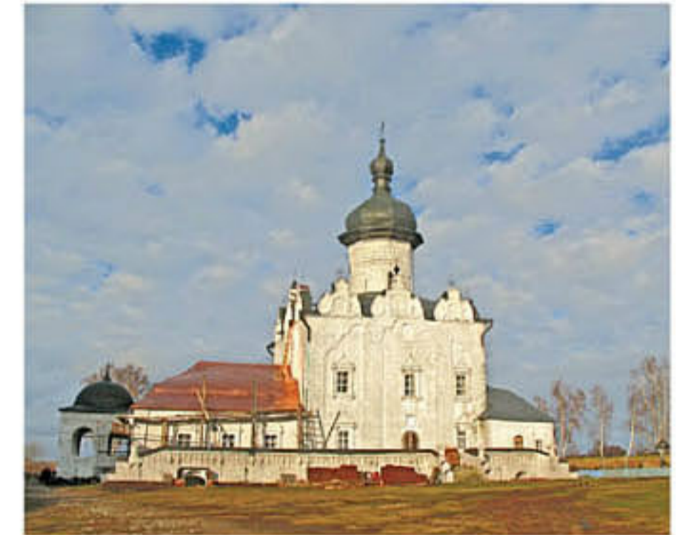
Успенская церковь (город Свияжск, республика Татарстан)