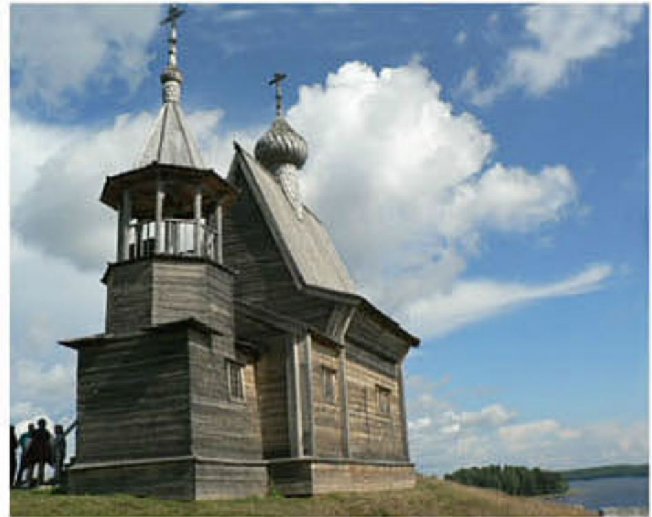
Никольская часовня (деревня Вершинино, Архангельская область)