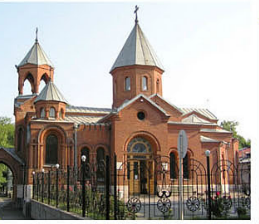
Армяно-Григорианская церковь (город Владикавказ, республика Северная Осетия-Алания)