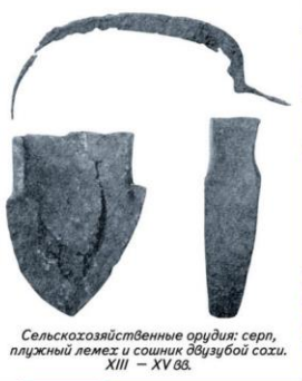
Сельскохозяйственные орудия: серп, плужный лемех и сошник двужубой сохи. XIII – XV вв.