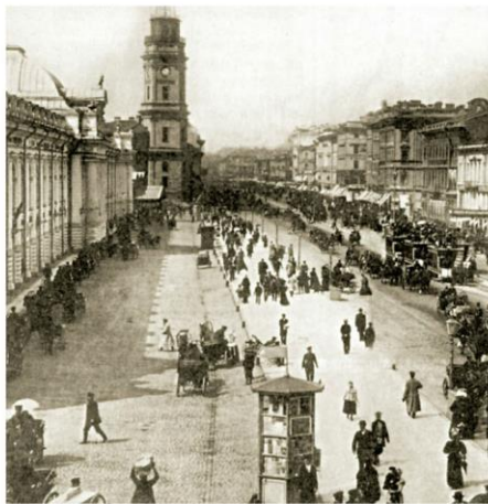
Невский проспект в начале XX века