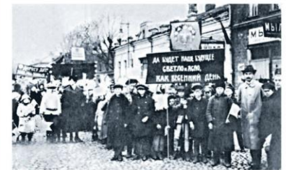
Дети на празднике Первомая (1920-е гг.)